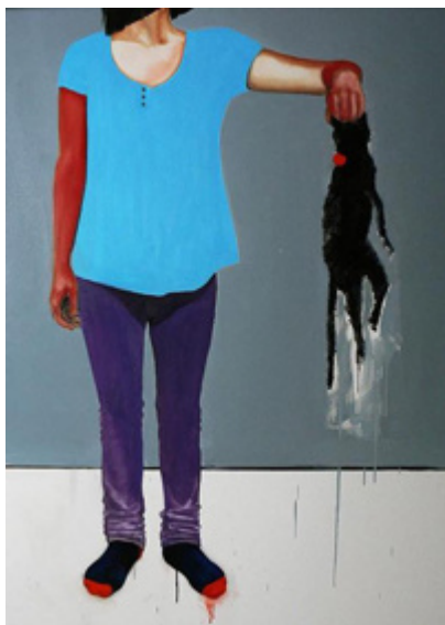
Marta Sala – ohne Titel (Katze), 2010