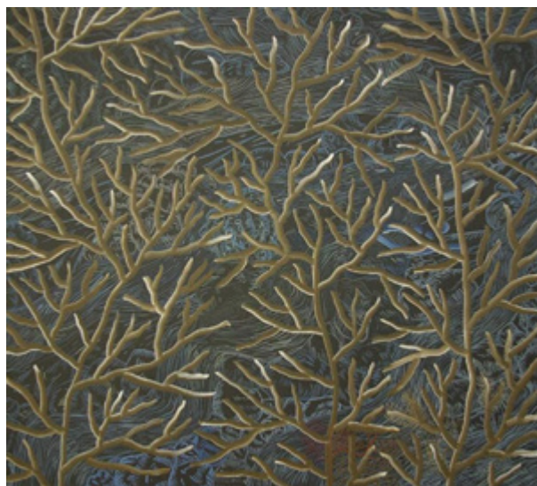
Małgorzata Wielek-Mandrela – Landschaft. 2008